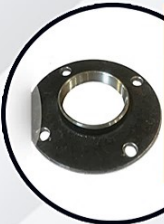
فلنج كلودار جوشي