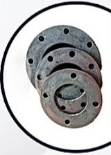
رينج تسمه اء

الحافة عبارة عن حزام على شكل شرائط يتم قطعها حسب حجم الحافة ويتم لحام طرفها معاً ، وتحتوي على عدة ثقوب على الجانبين لتوصيل البراغي والصواميل.