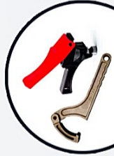
يانجر لي فلت

خرامة النشرة هي K.S.P ، والتي تخفق بسهولة تقنياً بحجم 16 مم على النشرة. تستخدم هذه الفتحة لتوصيل شريط الري بالتنقيط وكذلك أنبوب الري 16 مم بالنشرة.