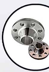
فلنج كلودار اسلين